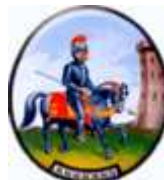
COMUNE DI MIGLIONICO